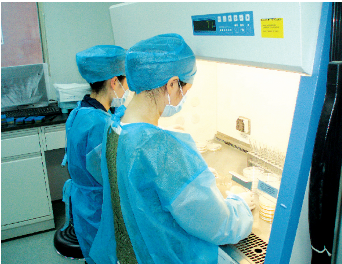
图为检验人员正在接受实战式培训